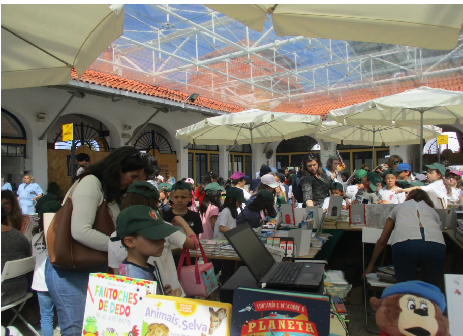
Os alunos na Feira do Livro de Leiria

Estes dias pretendem celebrar o livro, a leitura, o leitor, festejar a leitura como ato comunicativo, o diálogo entre as artes, e ser um espaço de encontro, criativo e colaborativo.